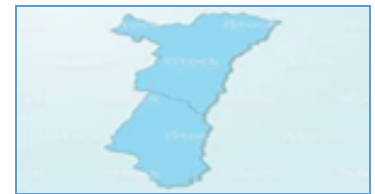
Bassin Universitaire Strasbourg