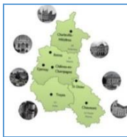
Bassin Universitaire de Reims Champagne - Ardenne